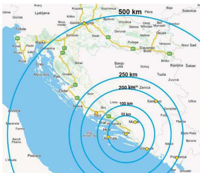
Slika 3. Prikaz udaljenosti gradova

U gradu Pločama postoji i prometno redarstvo koje je tek nedavno službeno započelo s radom. Prometni redar na području Grada Ploča obavlja poslove nadzora nepropisno zaustavljenih i parkiranih vozila (prometa u mirovanju), te upravljanja prometom.